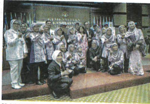
DR. DZULKEFLY (enam dari kanan) bergambar bersama warga emas selepas merasmikan Majlis Perasmian Sambutan Hari Warga Emas Peringkat KKM 2024 di Putrajaya semalam.

AKHBAR : KOSMO MUKA SURAT : 6 RUANGAN : NEGARA