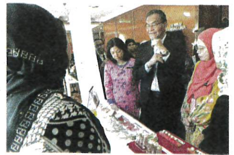
DR Dzulkefly (tengah) melawat reruai pameran majlis sambutan Hari Warga Emas peringkat KKM 2024, di Putrajaya.

"Objektif lain termasuk perluasan kebolehcapaian perkhidmatan kesihatan primer kepada warga emas di klinik desa yang bermula sejak Julai 2019 dan sehingga Jun 2024, sebanyak 146 buah klinik desa terlibat"