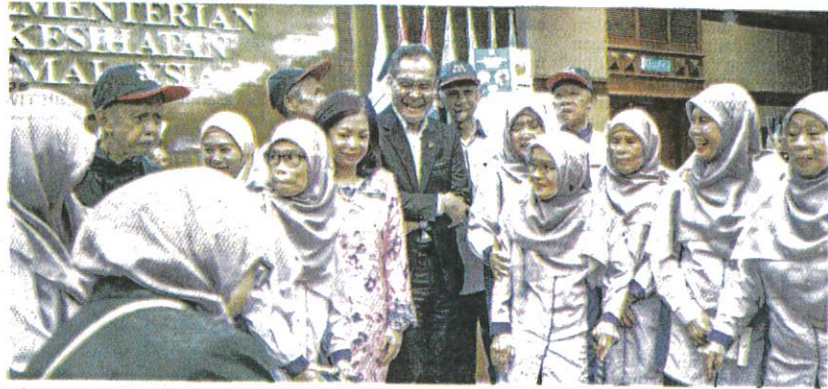
DZULKEFLY Ahmad beramah mesra bersama warga emas selepas merasmikan Majlis Perasmian Sambutan Hari Warga Emas Peringkat Kementerian Kesihatan Malaysia Tahun 2024 di Putrajaya semalam.

“Apapun banyak perkara masih dalam siasatan dan kami terlibat untuk memberikan kaunseling dan saya percaya bahagian Pusat Kecemerlangan Kesihatan Mental Kebangsaan (NCEMH) kita