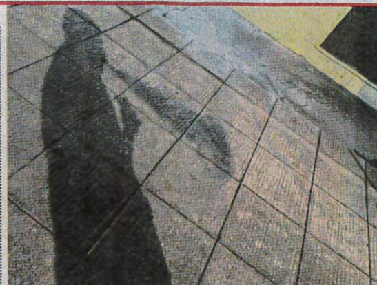
The shadow of a man using an e-cigarette in Kuala Lumpur on Monday. As of 2022, there were 1.4 million adult e-cigarette users in Malaysia.