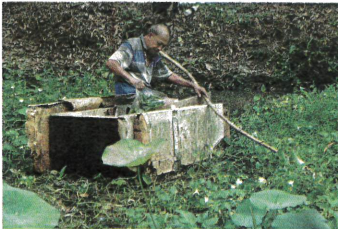
SEORANG warga emas menghabiskan masa terluang mengumpul sayur kangkung untuk dijual bagi menampung perbelanjaan sampingan selain membersihkan kolam takungan air daripada tumbuhan liar berhampiran rumahnya di Seksyen U5, Bandar Pinggiran Subang.

Beliau berkata, soal penjagaan kesihatan dan peng-