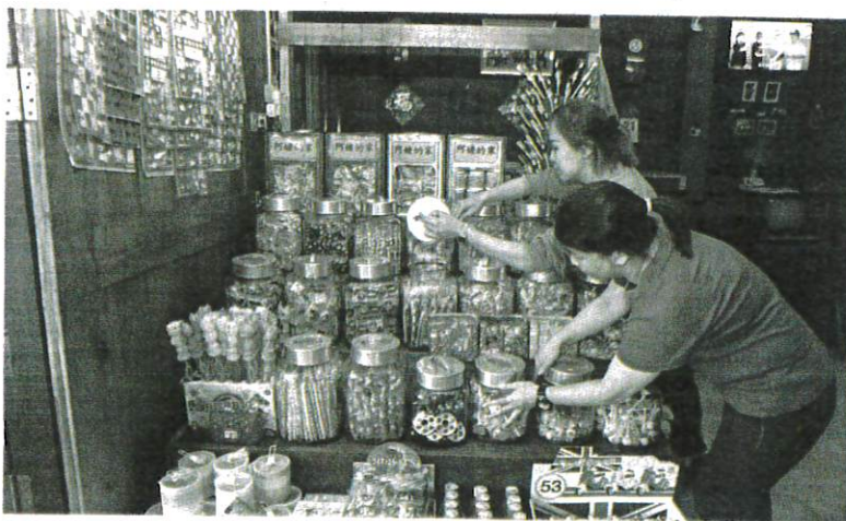
PANTAU jenis gula-gula atau makanan yang dimakan oleh anak-anak dan elakkan membeli produk daripada penjual yang tidak dikenali di platform e-dagang. - GAMBAR HIASAN

Fakulti Sains Kesihatan, Universiti Teknologi Mara (UiTM) Cawangan Pulau Pinang, Kampus Bertam